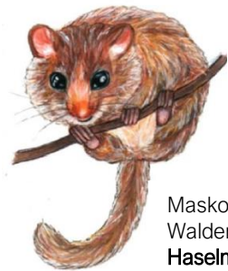
Maskottchen des Walderlebnispfades Haselmaus Henni