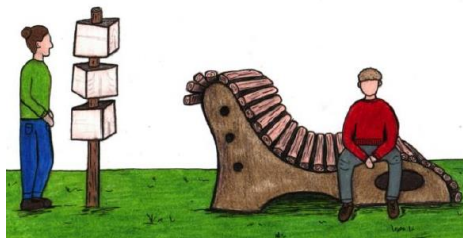
Drehwürfel und Familien- Relax- Liege