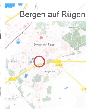
Auszug aus dem Geoportal des Landkreises V-R