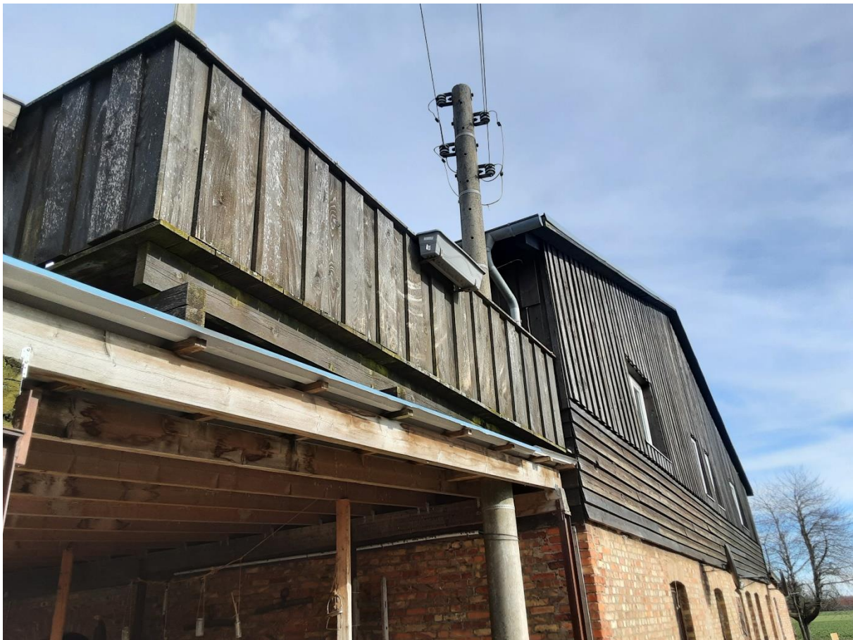
Abbildung 4: Nordseite des bestehenden Hauptgebäudes.

Da das Hauptgebäude des Reiterhofs in Zirmoisel zur ehemaligen Gutsanlage Zirmoisel gehört, ist davon auszugehen, dass möglicherweise Fledermausarten in Spalten oder Löchern ihr Sommerquartier haben. Potenzielle Verstecke finden sich zum Beispiel bei an der in der folgenden Abbildung dargestellten Hausseite.