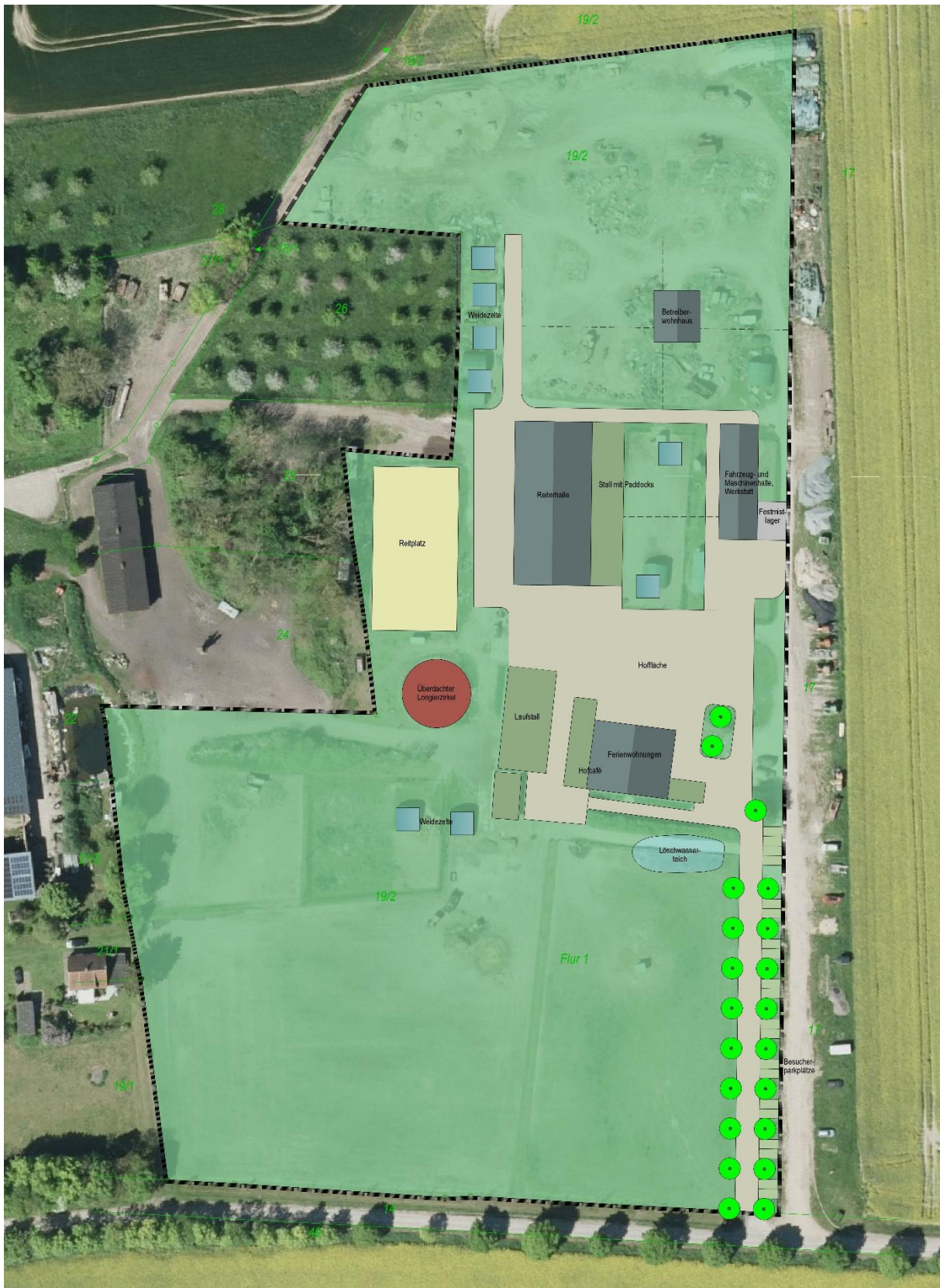
Abbildung 2: Auszug aus dem Vorhaben- und Erschließungsplan.