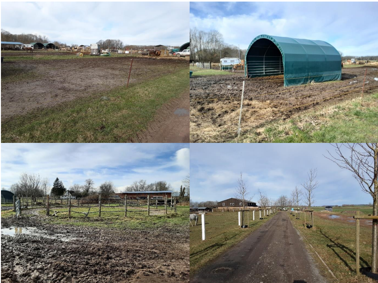
Abbildung 3: Offener Laufstall (l.o.), Paddock mit Unterstand (r.o.), bestehender offener Longierzirkel (l.u.) und Einfahrt mit jungen Alleebäumen rechts und links (r.u.).

Die bestehende Anlage, deren Bestandsgebäude ursprünglich zur früheren Gutsanlage Zirmoisel gehörte, bietet derzeit Pensionstierhaltung vor allem in offenen Laufställen bzw. Paddocks mit Unterstand an und organisiert Ausritte und Wanderreiten sowie Kutschfahrten. Im zweigeschossigen historischen Stallgebäude befinden sich neben der Betreiberwohnung und einer kleinen Werkstatt zwei kleinere Ferienwohnungen. Auch wenn durch 20 ha angepachtetes Grünland derzeit eine eigene Futtergrundlage besteht, wird der Betrieb als reines Touristikunternehmen geführt.