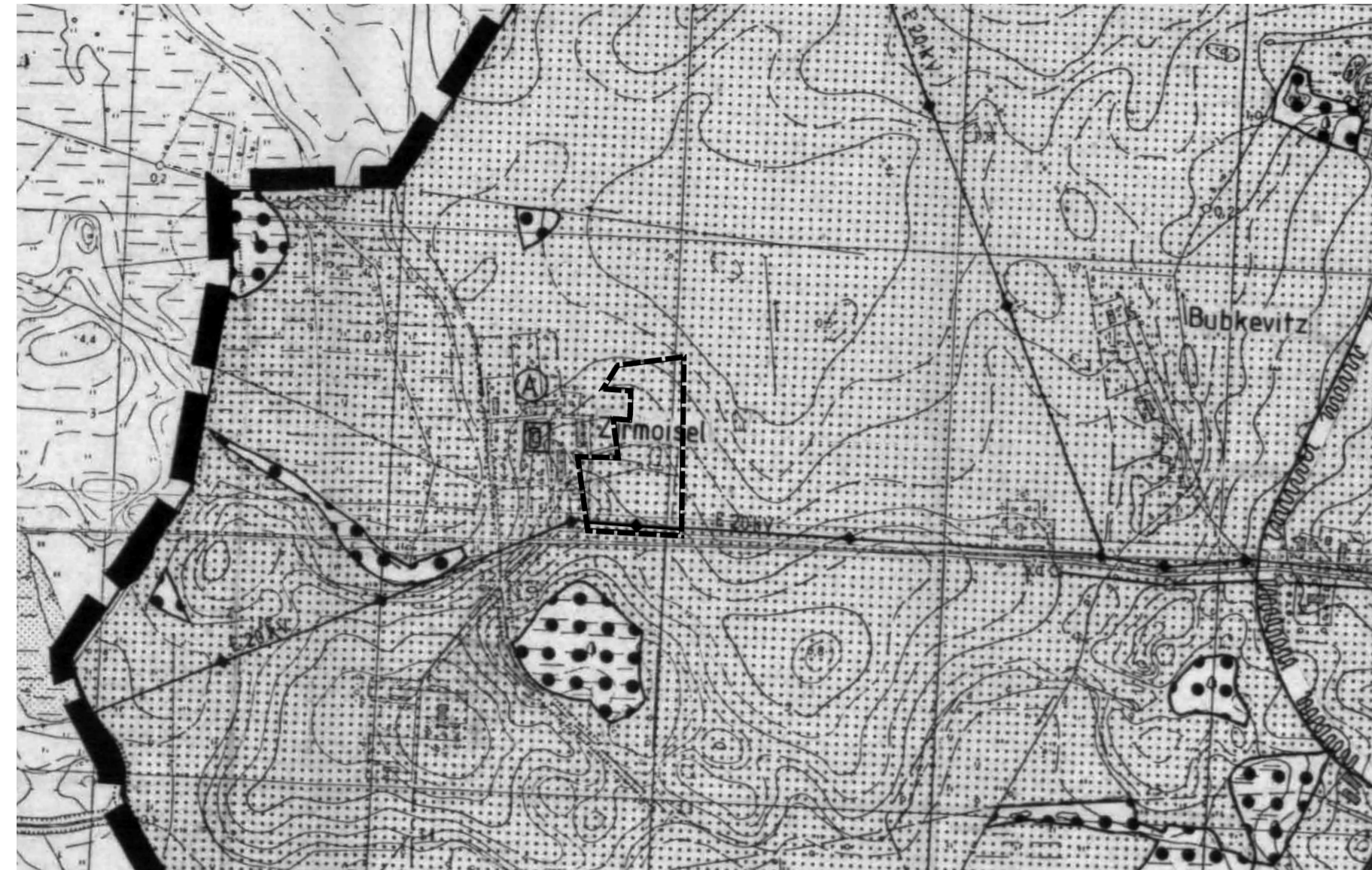
Planzeichnung: Aktuelle Darstellung im Flächennutzungsplan