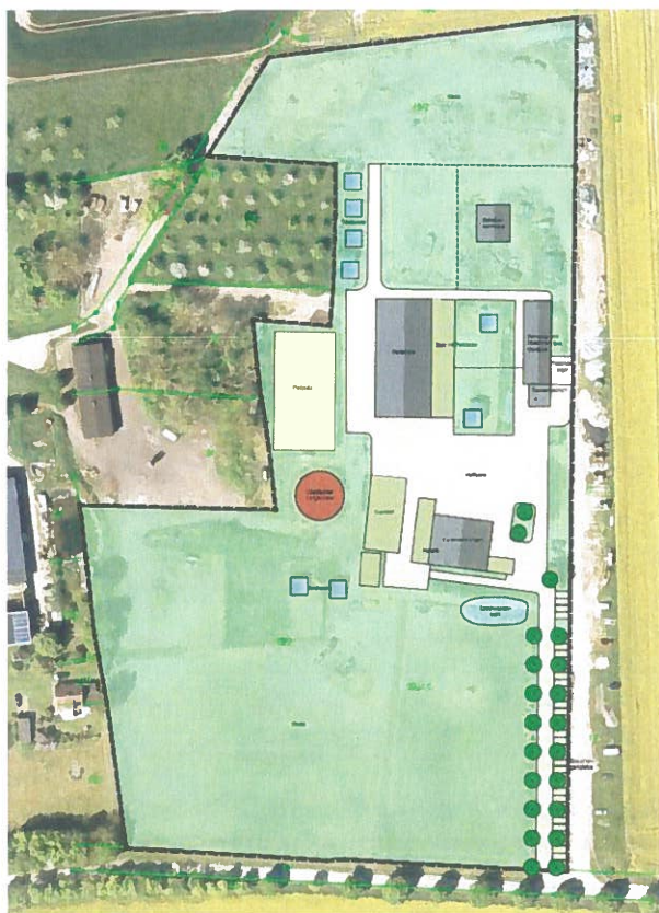
Auszug aus dem Vorhaben- und Erschließungsplan

Montag – Donnerstag von 08:00 – 12:00 Uhr und 13:00 – 16:00 Uhr zusätzlich Dienstag von 13:00 – 18:00 Uhr und Freitag von 08:00 – 12:00 Uhr.