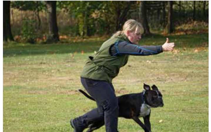
Sportsfreundin J. Krüger mit Jäck in der Unterordnung

Im Anschluss starteten Begleithundeprüfungen. Auch in dieser Kategorie bestanden die teilnehmenden Teams die Prüfung.