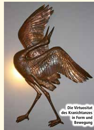
Die Virtuosität des Kranichtanzes in Form und Bewegung