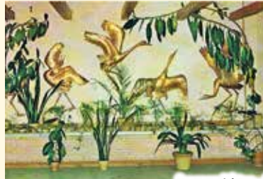
Innenansichten – Fotos vor Brand 1988

Handwerk. Der Künstler ist eine Steigerung des Handwerks “. Auch wenn er kurzzeitig 1934 der SA beitrug und nach 4 Jahren wieder ausgeschlossen wurde, so war er Zeit seines Lebens ein kritischer Mensch. * Zwei Jahre nach dem Ende des 2. Weltkrieges übernahm er in Empfertshausen in Thüringen eine Fachklasse für