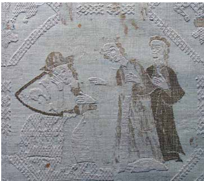
Schlafender Herr mit halbem Lilienwappen und die Dame mit der Lilienkrone, Ausschnitt aus der Bergener Decke