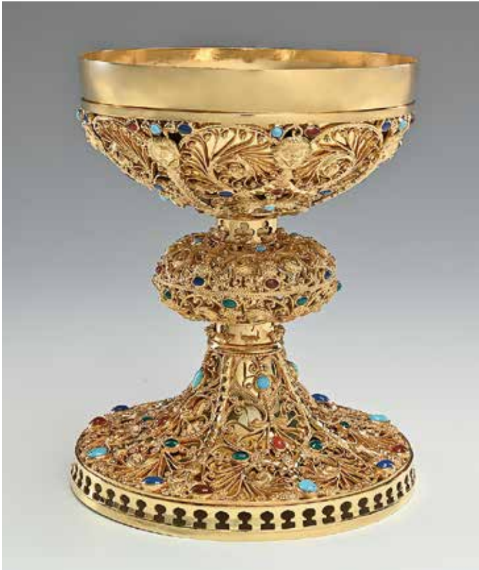
Kelch ganz und Kelchsausschnitt