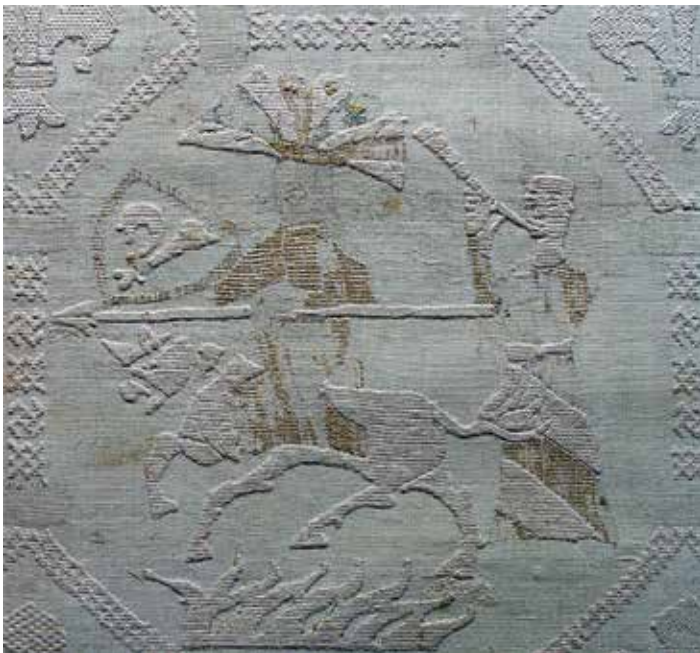
Turnierszene, Ausschnitt aus der Bergener Decke

Das prächtige, mittelalterliche Leinentuch (gefertigt um 1330) mit seinen eindrucksvollen Stickereien gehört neben der Replik des romanischen Kelches zu den Highlights in der Dauerausstellung des Stadtmuseums Bergen auf Rügen.