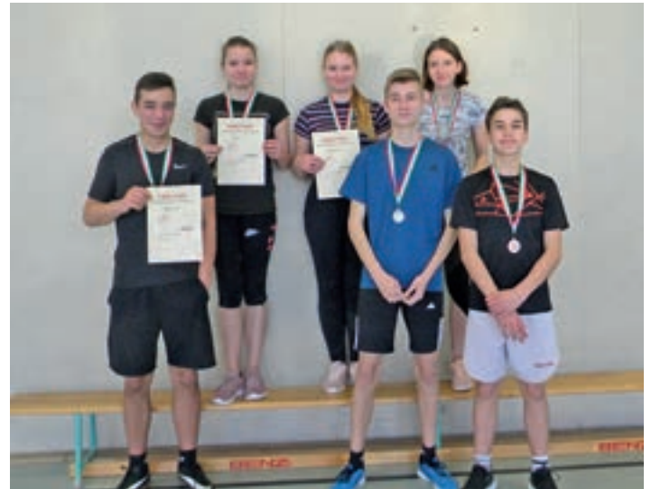
Die Platzierten der Klassenstufen 9/10.