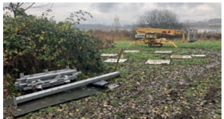
Neue Fundamente für den 2. Beobachtungsturm (Stand 4.12.2019)

Kosten: ca. 72.500,00 brutto | Baubeginn: 18.06.2019 Fertigstellung: 09.01.2020 Abnahme