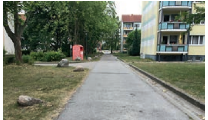
Ausbau Stichstraße Straße der DSF zwischen Nr. 21-27 und 41-51 mit einem befahrbaren Gehweg in Bergen auf Rügen – 57 Tsd. €