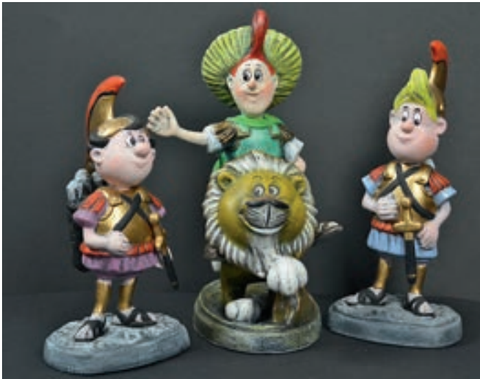
Digedags und Fix und Fax