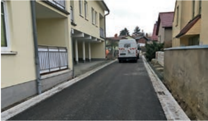
Ausbau und Erschließung „Südliche Altstadt“, 2. Bauabschnitt Weidenstraße, zwischen Wasserstraße und Gadmundstraße - 1,457 Mio. €