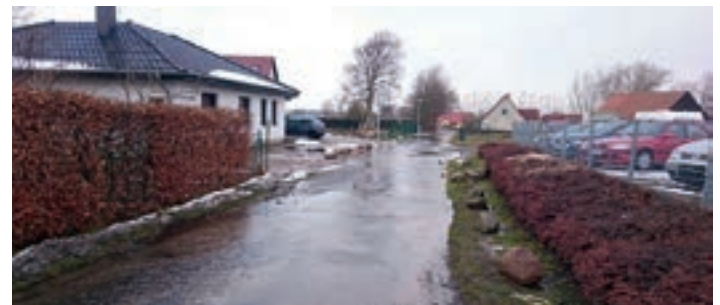
Regenwasserableitung Ramitz – 340 Tsd.