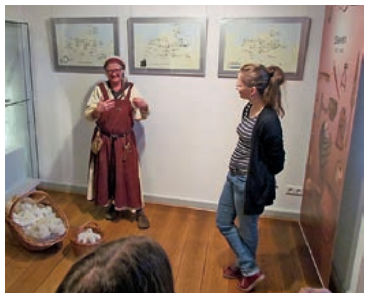
Slawenführung (Urheber: Wendenpferd, eine Rügen-Saga e.V.)

macherey, Bergen auf Rügen) zeigen dabei z.B. den Gebrauch von Handspindeln. Den Besuchern wird somit der Zusammenhang zwischen ausgewählten Objekten in der Vitrine und ihrer einstigen Funktion vorgeführt.