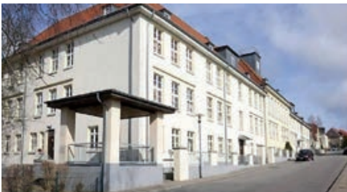
Sanierung der Grundschule Altstadt Bergen auf Rügen – 3,7 Mio. €