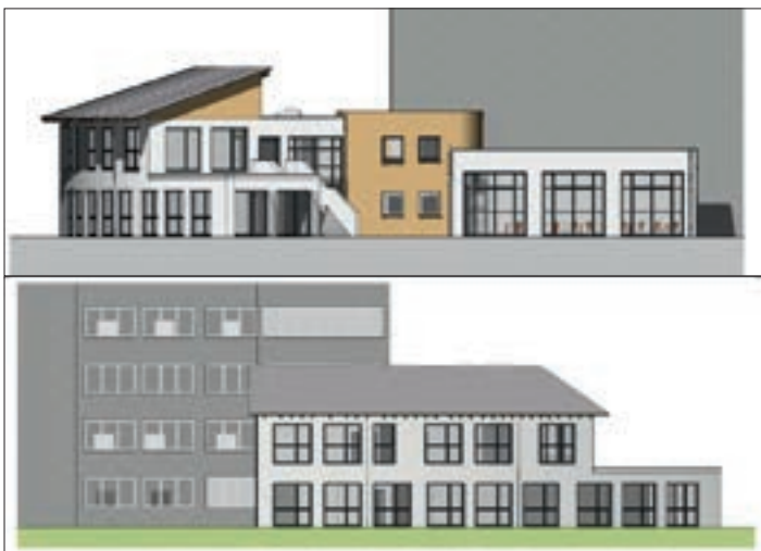
Hortanbau Grundschule „Am Rugard“ – 4,0 Mio. €