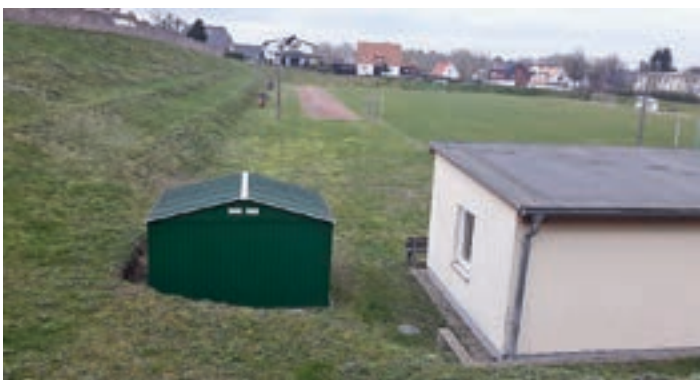
Sanierung des Sportplatzes der Grundschule Altstadt Bergen auf Rügen – 1,6 Mio. €