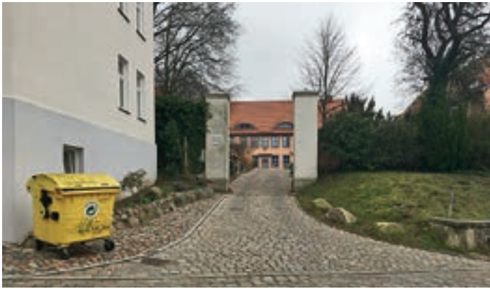
Behindertengerechte Zuwegung zum Stadtmuseum in Bergen auf Rügen – 100 Tsd. €