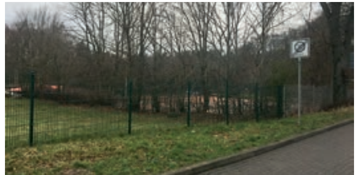
Zufahrt zum Tennisplatz an der Rugardstraße – 53 Tsd. €