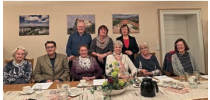
NEU: Eine Sprechstunde findet immer vor der Sitzung von 14.00 Uhr – 14.30 Uhr im Rathaus, Zimmer 308 statt.