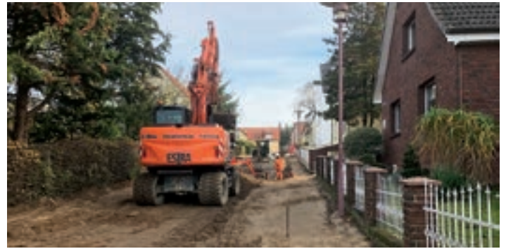
Ausbau der Breitscheidstraße – 480 Tsd. € (Stand 4.12.2019)