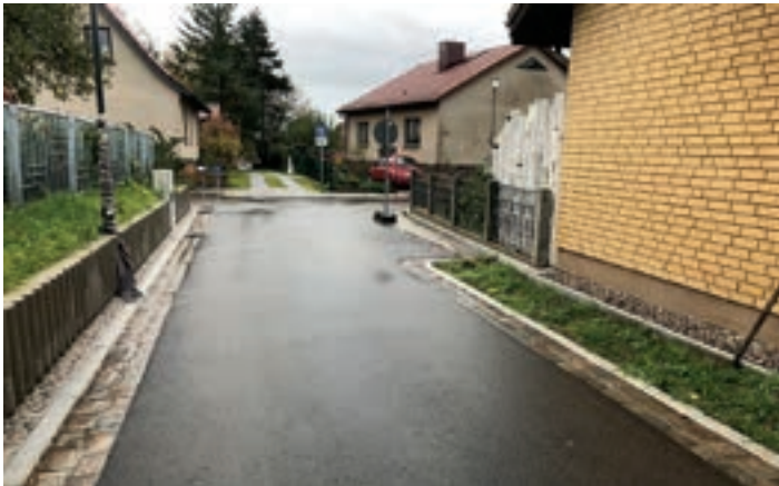
Ausbau und Erschließung „Südliche Altstadt“, 2. Bauabschnitt Gadmundstraße - unterer Teil