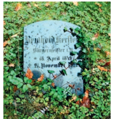
Reinhold Kersten Haus, Portrait Kersten, Grabstein Reinhold Kersten