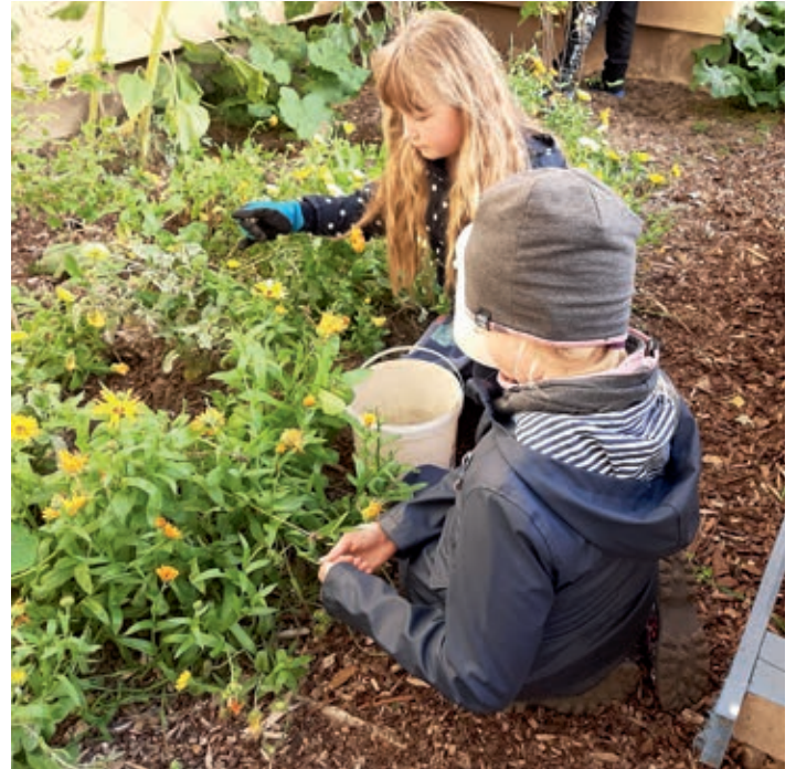
Schülerinnen der Grundschule „Am Rugard“ ernten Ringelblumensamen im Grünen Klassenzimmer