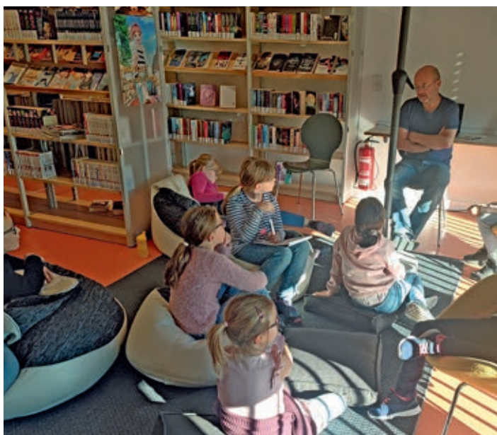
AG „Schülerzeitung“ der Grundschule „Am Rugard“ beim \beta -kongress im MIZ Bergen auf Rügen