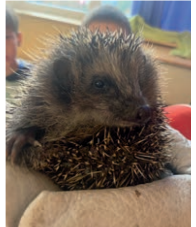
Igelbabys der Tiernotrettungsstation

Wie jedes Jahr nahm der Herbst an der Grundschule „Am Rugard“ nach den Herbstferien so richtig Einzug. Da wurde gesungen, gehämmert, gebastelt, gebacken, gemostet, recherchiert, gemalt, gerechnet, geschrieben, Gedichte gelernt und sich an digitalen Medien und Power Point-Präsentationen ausprobiert. Während die ersten Klassen das Thema „Apfel“ bearbeiteten, erfuhren die 2. Klassen alles über das Leben der Igel und die 3. Klassen alles über das Eichhörnchen. Die 4. Klassen erkundeten den Lebensraum Wald. Am Ende entstand eine tolle und vielfältige Ausstellung mit den Ergebnissen aller Klassen sowie ein eindrucksvoller Film über die Projektwoche.