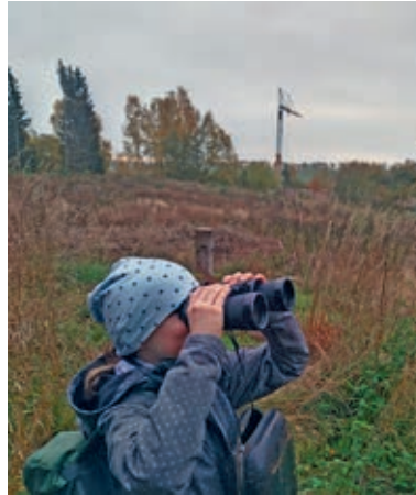
Schülerin auf Entdeckungstour im Rugard