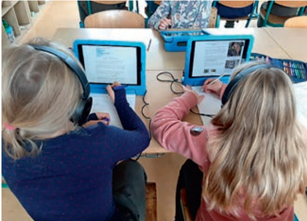
Schülerinnen bei der Recherche für den Steckbrief