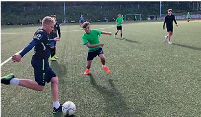
Endspiel Klassenstufe 9/10 RegS Göhren gegen RegS „Am Grünen Berg“ Bergen

Nach zweijähriger coronabedingter Zwangspause der Schulsportwettkämpfe fand auf Rügen der erste schulübergreifende Wettkampf, das mittlerweile 8. Fußball-Kleinfeldturnier der Rügener Schulen, statt.