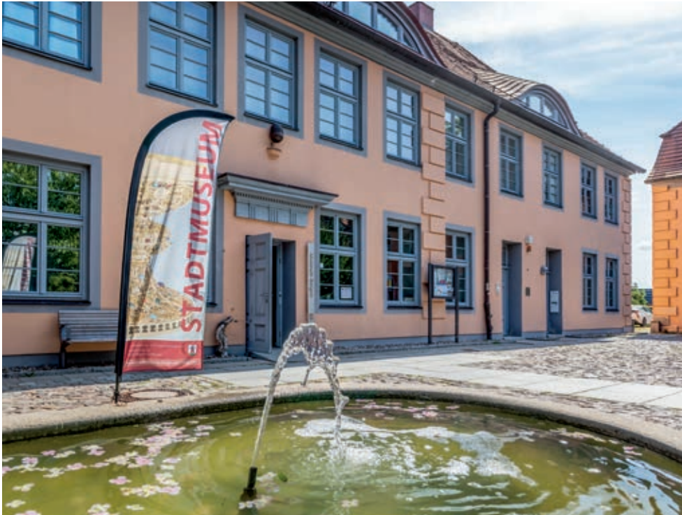
Stadt-Museum Bergen auf Rügen | Foto: Konrad Nickel