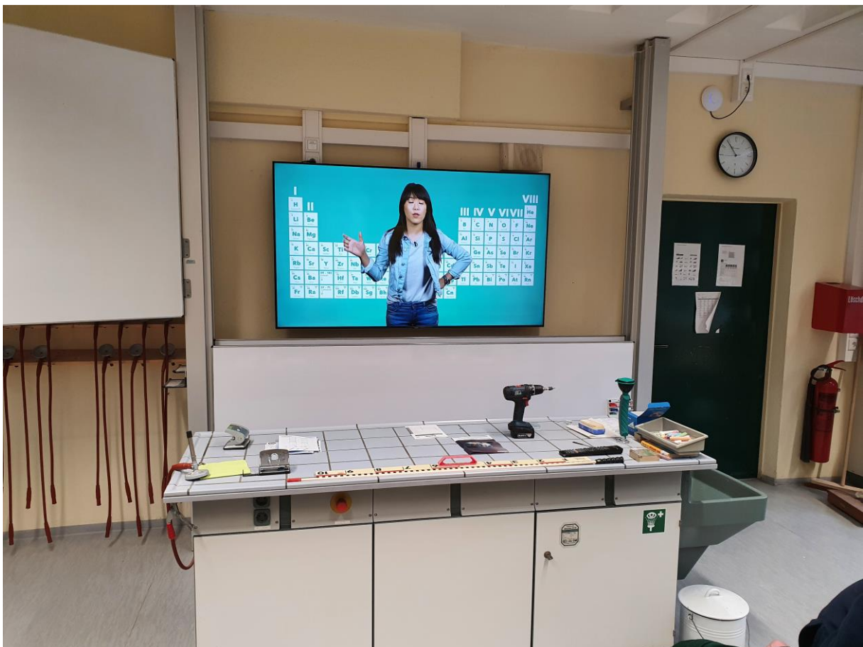
Ein Klassenraum nach der Bauausführung mit digitaler Präsentationstechnik in Bauphase 1