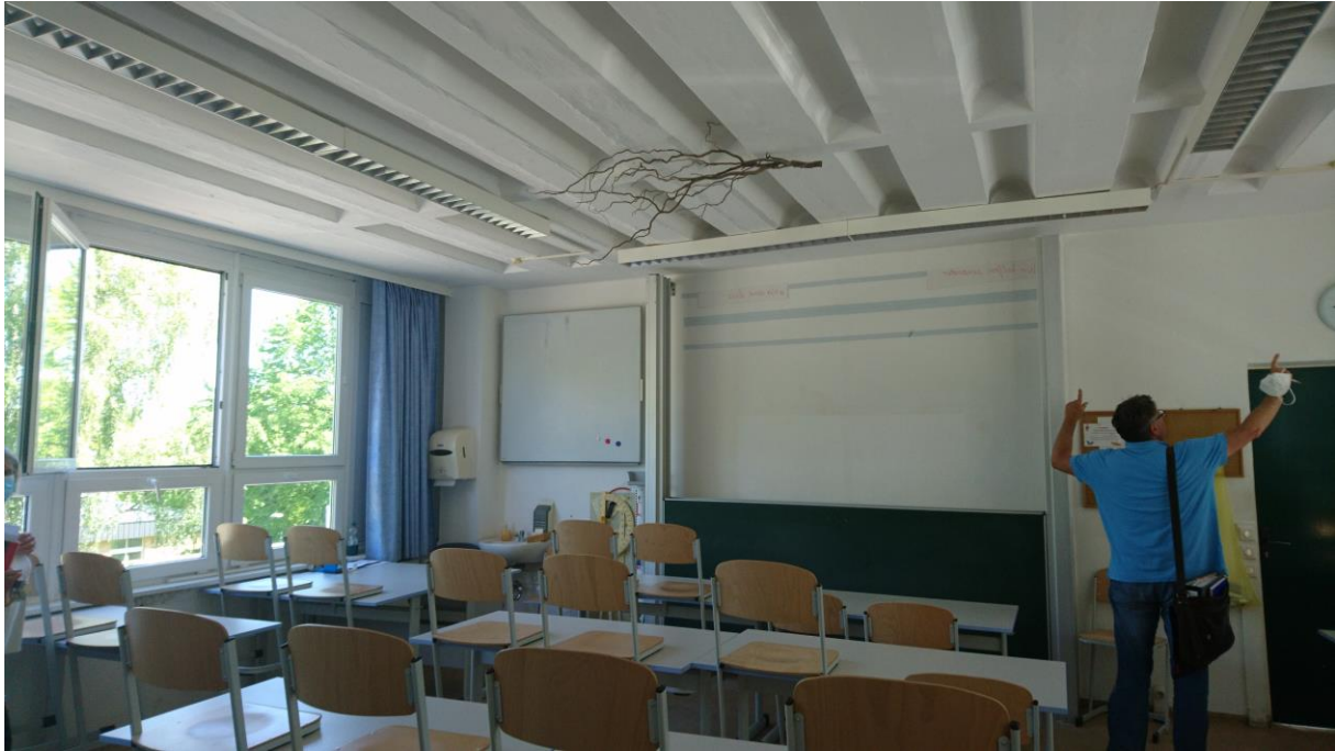
Ein Klassenraum vor Bauausführung