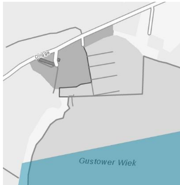
Abb. 1: Lage des Plangebietes in Gustow zum GGB DE 1747-301 (o.M.)