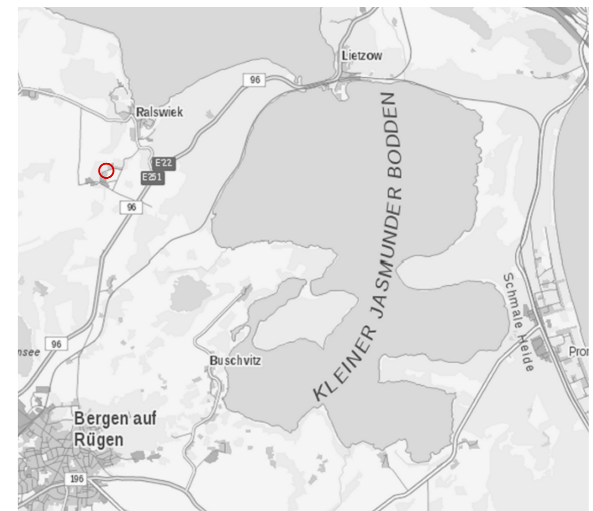
Übersichtskarte unmaßstäblich

Aufgrund § 10 BauGB in der Fassung der Bekanntmachung vom 3. November 2017 (BGBl. I S. 3634), geändert durch Artikel 1 des Gesetzes vom 14. Juni 2021 (BGBl. I S. 1802) sowie auf Grund § 86 LBauO in der Fassung der Bekanntmachung vom 15. Oktober 2015 (GVBl. M-V 2015, S. 344), zuletzt geändert durch Gesetz vom 26. Juni 2021 (GVBl. M-V S. 1033), wird nach Beschlussfassung durch die Gemeindevertretung vom ..... folgende Satzung über den Bebauungsplan mit örtlichen Bauvorschriften Nr. 8 "Dorfstraße Jarnitz", bestehend aus Planzeichnung (Teil A) und Textlichen Festsetzungen (Teil B), erlassen.