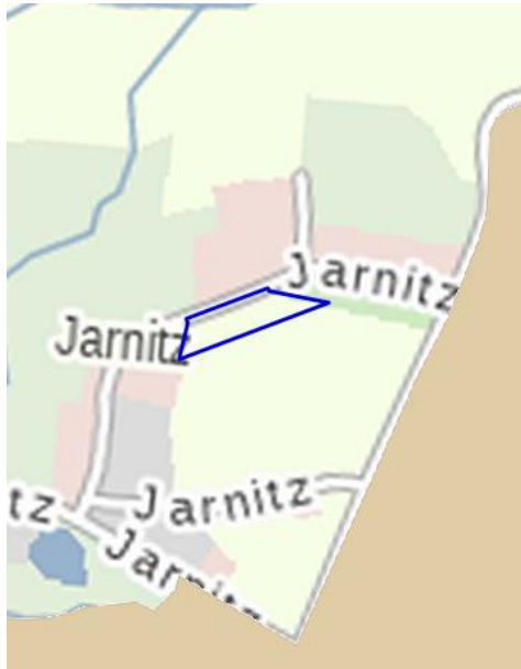
Abbildung 1: Lage des Plangebietes (dunkelblaue Konturen) sowie die Fläche des nahen VSG DE 1446-401 (hellbraune Fläche).