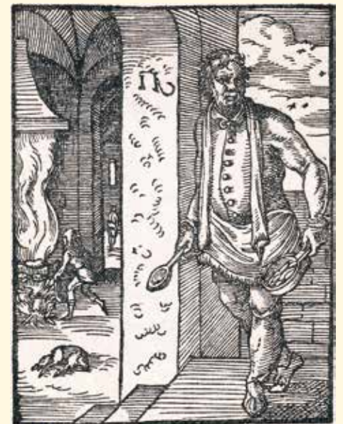
Gastwirt und Koch, Holzschnitt um 1561