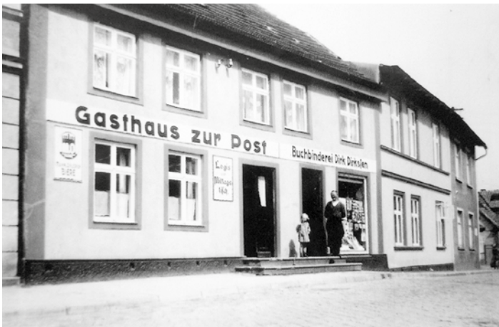
„Gasthaus zur Post“ Ecke Raddasstraße/Markt.