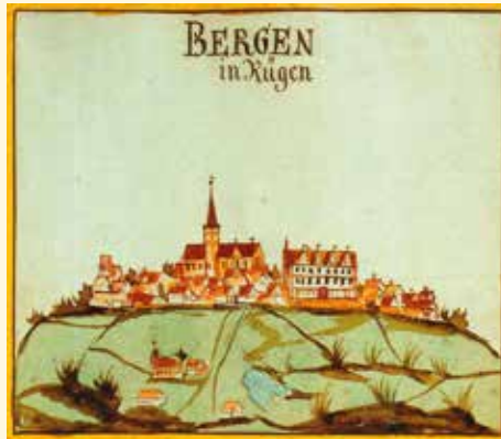
Bergen im 17. Jahrhundert mit Koophus und Schloß aus der Pommerschen Bilderhandschrift

60 Mark und zwei Pfund Honig. In den Jahren 1317 und 18 führte der Krugbesitzer eine Abgabe von 2 Scheffeln Bischofsroggen an den Landpropst zu Ralswiek ab. Dieser war der Vertreter des Bischofs zu Roskilde. * In den folgenden Jahren entwickelte sich der Marktflücken