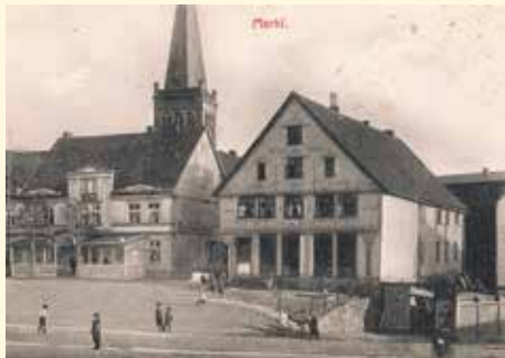
Das Hotel „Ratskeller“ um 1907 mit typischer Holzveranda